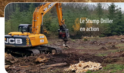
Le Stump Driller en action