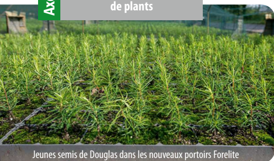
Jeunes semis de Douglas dans les nouveaux portoirs Forelite